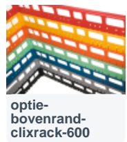
optie- bovenrand- clixrack-600