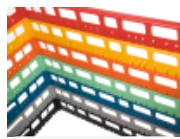
optie- bovenrand- clixrack-600