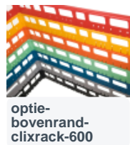
optie- bovenrand- clixrack-600