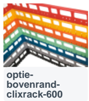
optie- bovenrand- clixrack-600